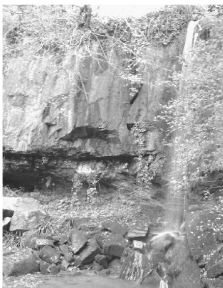
La cascata Schivanoia di Teolo