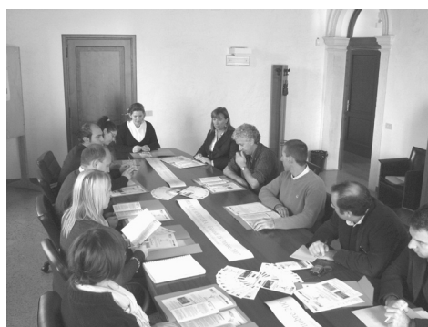
Un momento della conferenza stampa di presentazione del progetto